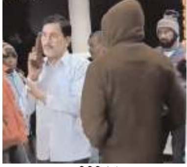
नगर प्रतिनिधि | भोपाल

शहडोल में रेत माफिया ने पुलिस पर हमला कर दिया। टीआई और एक आरक्षक घायल हुए हैं। मौके से दो आरोपी पकड़े गए हैं। घाट पर ट्रैक्टर छुड़ा ले जाने के बाद पुलिस माफिया के घर दबिश देने गई थी। यहाँ पूरा परिवार पुलिससकर्मियों पर टूट पड़ा। आरोपियों ने पुलिस पर ट्रैक्टर चढ़ाने की धमकी भी दी थी।