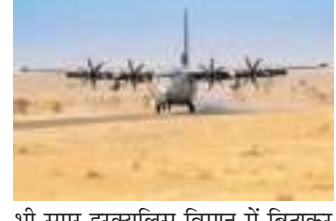
भी सुपर हरक्यूलिस विमान में बिठाकर कारगिल भेजा गया। गरुड़ कमांडोज

भारतीय वायुसेना वायुसेना ने अपने सी-130जे सुपर हरक्यूलिस विमान को रात के समय कारगिल हवाई पट्टी पर उतारने में सफलता हासिल की है। आपात स्थिति से निपटने की यह कमांडोज की ट्रेनिंग का हिस्सा थी। दरअसल इस दौरान वायुसेना के गरुड़ कमांडोज को