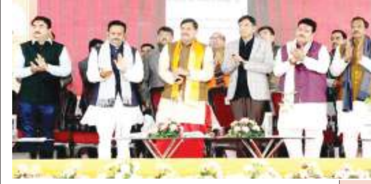
नगर प्रतिनिधि | भोपाल

मुख्यमंत्री डॉ. मोहन यादव ने कहा है कि महाकाल दर्शन के लिए आने वाले श्रद्धालुओं को इस परिसर में प्रसादम के माध्यम से हेल्दी फूड मिलेगा। अच्छे स्वास्थ्य के लिए अच्छे आहार के विचार को क्रियान्वित किया जा रहा है। जन-स्वास्थ्य रक्षा सरकार की प्राथमिकता है। इस नाते गत कुछ सप्ताह में खुले में खाद्यान्न सामग्री बेचने और अस्वच्छ तरीके से मौस्यहार के विक्रय पर अंकुश के लिए 25 हजार से अधिक दोषी लोगों को दंडित किया गया है। नागरिकों को अच्छे स्वास्थ्य देना राज्य सरकार की प्राथमिकता है। मुख्यमंत्री डॉ. यादव ने कहा कि भारत सरकार प्रत्येक लोकसभा क्षेत्र में एक मेडिकल कॉलेज के लिए संकल्पबद्ध है। इसके साथ ही प्रत्येक जिले में मेडिकल कॉलेज हो, इस दिशा में